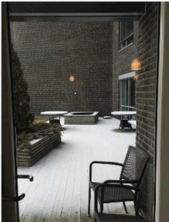
Uteplass / uteservering.