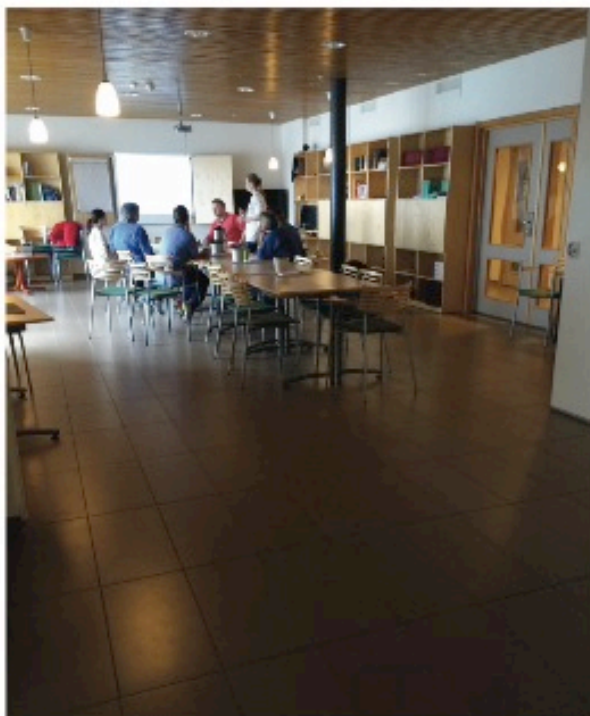
Nåværende kantine / restaurant. Mot storkjøkken.