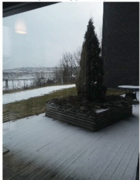
Uteplass / uteservering.