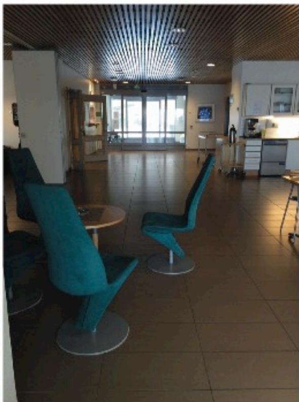
Kantine / restaurant, mot hovedinngang.