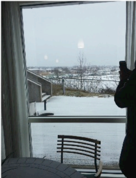
Utsikt mot Seut-elva og Fjeldberg båthavn.