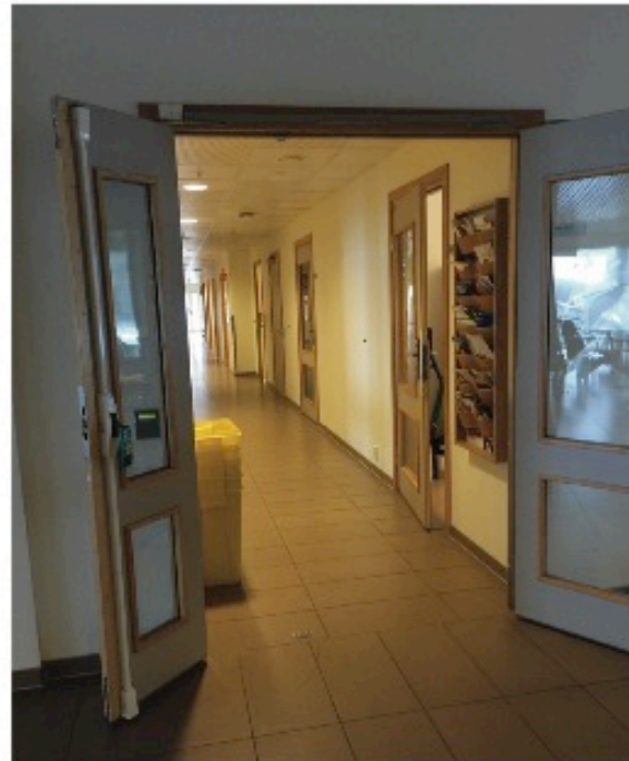
Låsbar dør til legekantor fra vestibyle/resepsjon.

Alle bilder er tatt selv. Slik ser det ut her i dag.