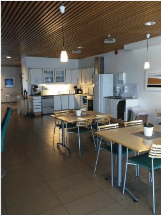
Restaurant / kantine.