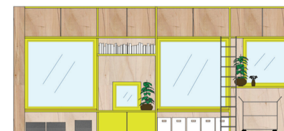
Oppriss av sitte- og oppbevaringsmøbel i klasserom