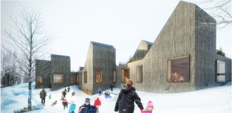
ILLUSTRASJON AV KISTEFOSDAMMEN BARNEHAGE AV CHRISTIANSEN OG CO ARKITEKTER

PROSJEKTERING AV BARNEHAGE VAR ET VELDIG INTER- ESSANT OG SPENNENDE KURS. DET HANDLET OM ALLE FASENE I EN UTVIKLINGSPROSESS AV BARNEHAGER. PRESENTASJON AV FORSKJELLIGE PROSJEKTER OG SA- MARBEID MELLOM ARKITEKTER OG PEDAGOGER. SELV OM JEG IKKE HAR SKAL RENOVERE EN BARNEHAGE MEN EN SFO FØLTE JEG DETTE KURSET VAR NYTTIG I OG MED AT DET HANDLER OM BARN OG HVORDAN EN SKAL BYGGE HUS OG ROM SOM PASSER TIL DE -FOR DE.