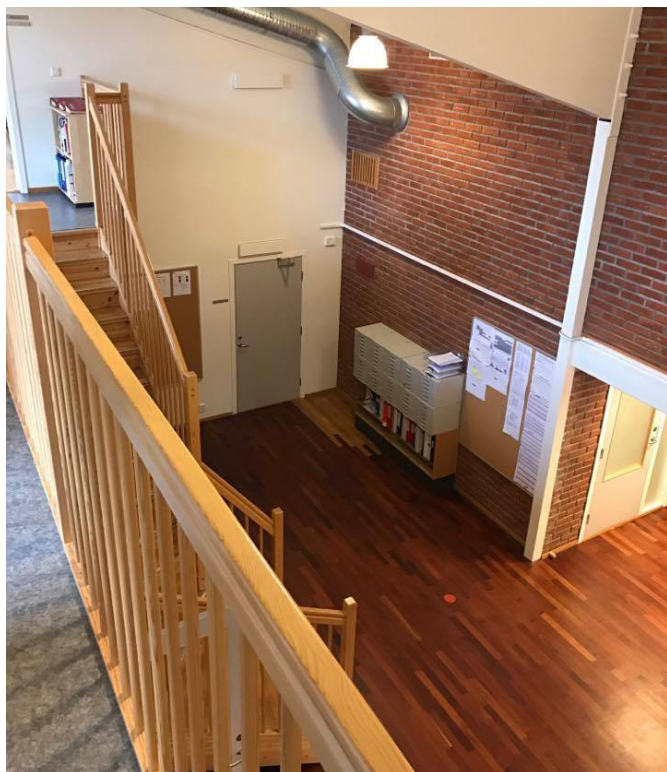
BILDE FRA HEMSEN NED TIL 1. ETASJE.

DER HVOR SFØEN LÅ TIDLIGERE ER DET I DAG ADMIN- ISTRASJONSBYGG FOR LÆRERE. DENNE DELEN HAR DER- FOR BLITT TILPASSET ETTER DETTE. ROMMET (AULAEN) HAR BLITT DELT INN I FLERE SÅ ROM OG KONTORER SAMT AT DET HAR BLITT SATT INN RESEPSJON VED IN- NGANGEN. HEMSEN BLIR OGSÅ BENYTTET TIL KONTORER OG ET LITE BIBLIOTEK. ETTER Å HA SETT PÅ KON- STRUKSJONENE I DENNE DELEN KAN EN SE AT DET ER DRAGERE I TAKET SOM HOLDER OPPE BYGGET OG AT DET DERFOR ER LITE INNVENDIGE BÆRENDE VEGGER. DETTE GJØR DET LETTERE Å LAGE NY PLANLØSNING. ROMMET HAR FORTSATT DE GODE KVALITETENE SOM JEG KAN HUSKE FRA JEG VAR BARN OG SELV GIKK PÅ SKOLEN. DET ER HØYT TIL HIMLINGEN OG ROMMENE ER STORE OG LYSE.