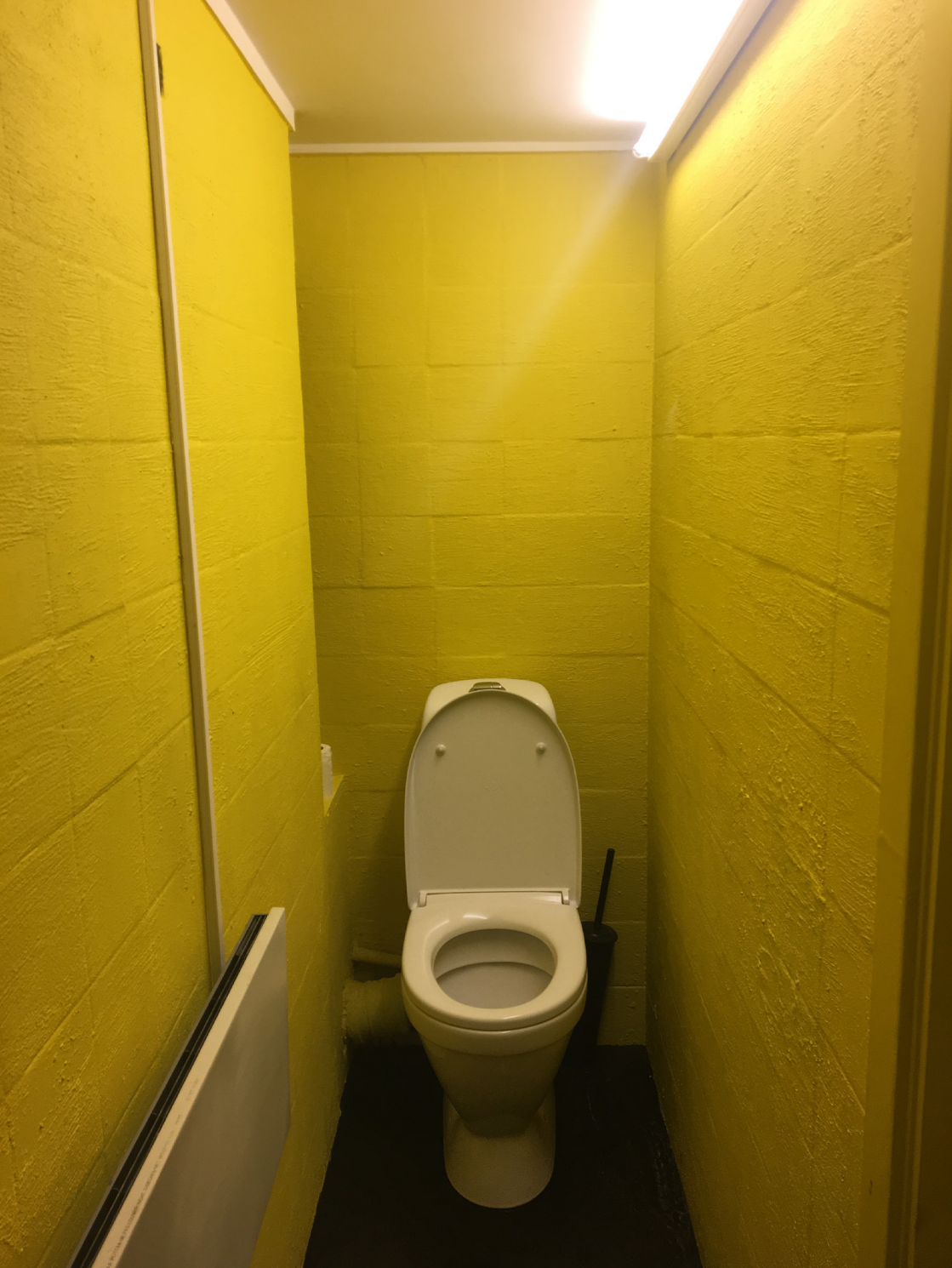
DAPPER OSLO // gult-er-kult toalett