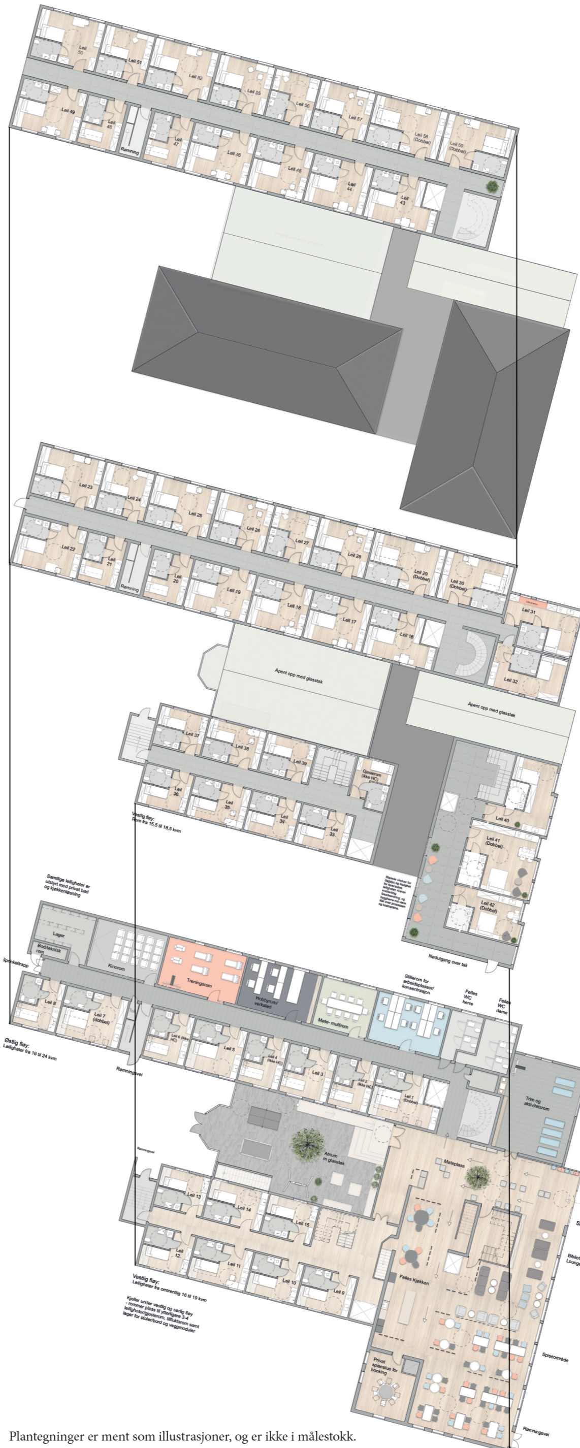
Plantegninger er ment som illustrasjoner, og er ikke i målestokk.

Et lettvegg- system med moduler på skinner er dannet med et fleksibelt grid-system. På denne måten kan modulene avgrense soner, og gi en følelse av trygghet.