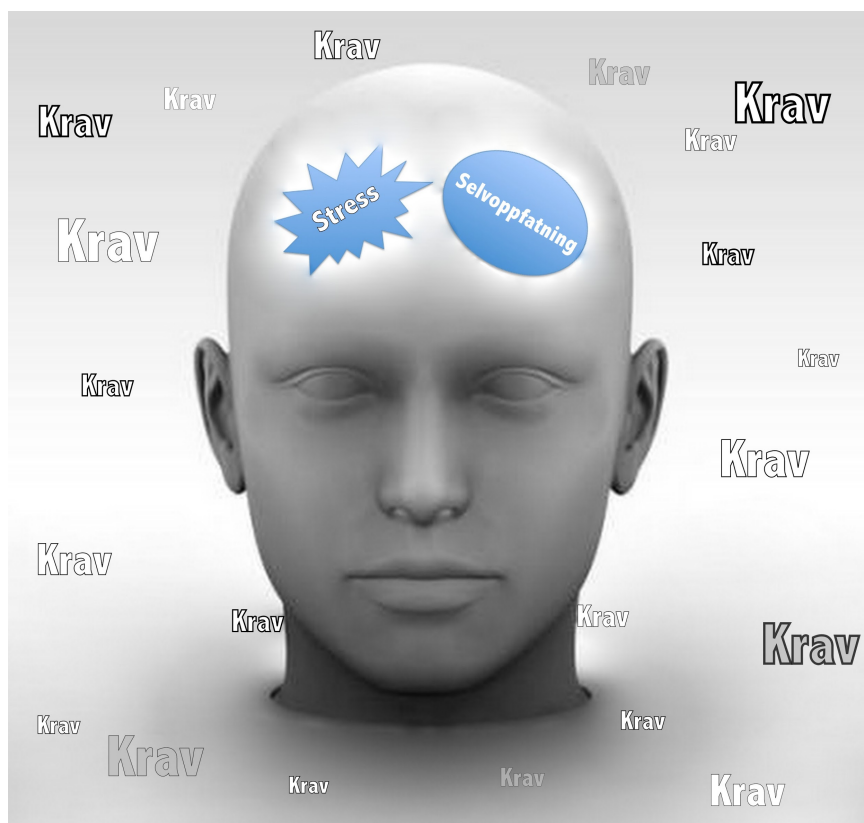
Modell 1.1 Konseptuell modell

På bakgrunn av ovennevnt teori er det ingen tvil om at stadig nye krav til ledelse, så vel som lederens subjektive opplevelse av, og evne til å mestre, kravene påvirker både egen opplevelse av stress og selvoppfatning. I modellen under har vi forsøkt å illustrere hvordan ledere omringes av krav og betydningen dette har for hans/ hennes opplevelse av nettopp stress og selvoppfatning.