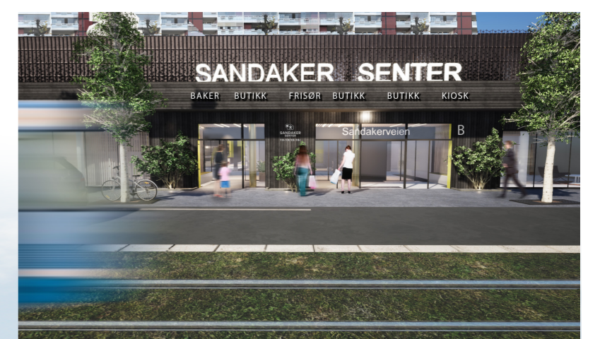
FASADE INNGANG B