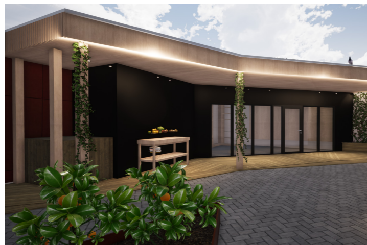
REDSKAPSBOD MED KOMPOST