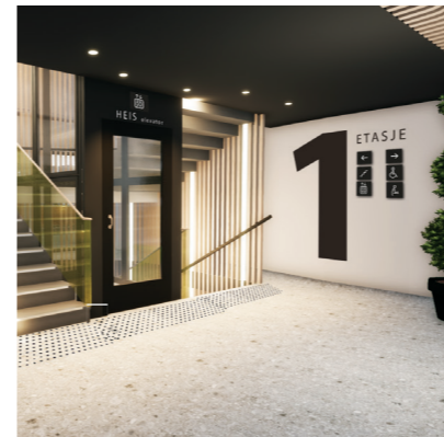
INTERN TRAPP MED HEIS

Ca. 1 200 m 2 med sedumtak tilpasset klimaendringer og behov for flere grøntarealer.