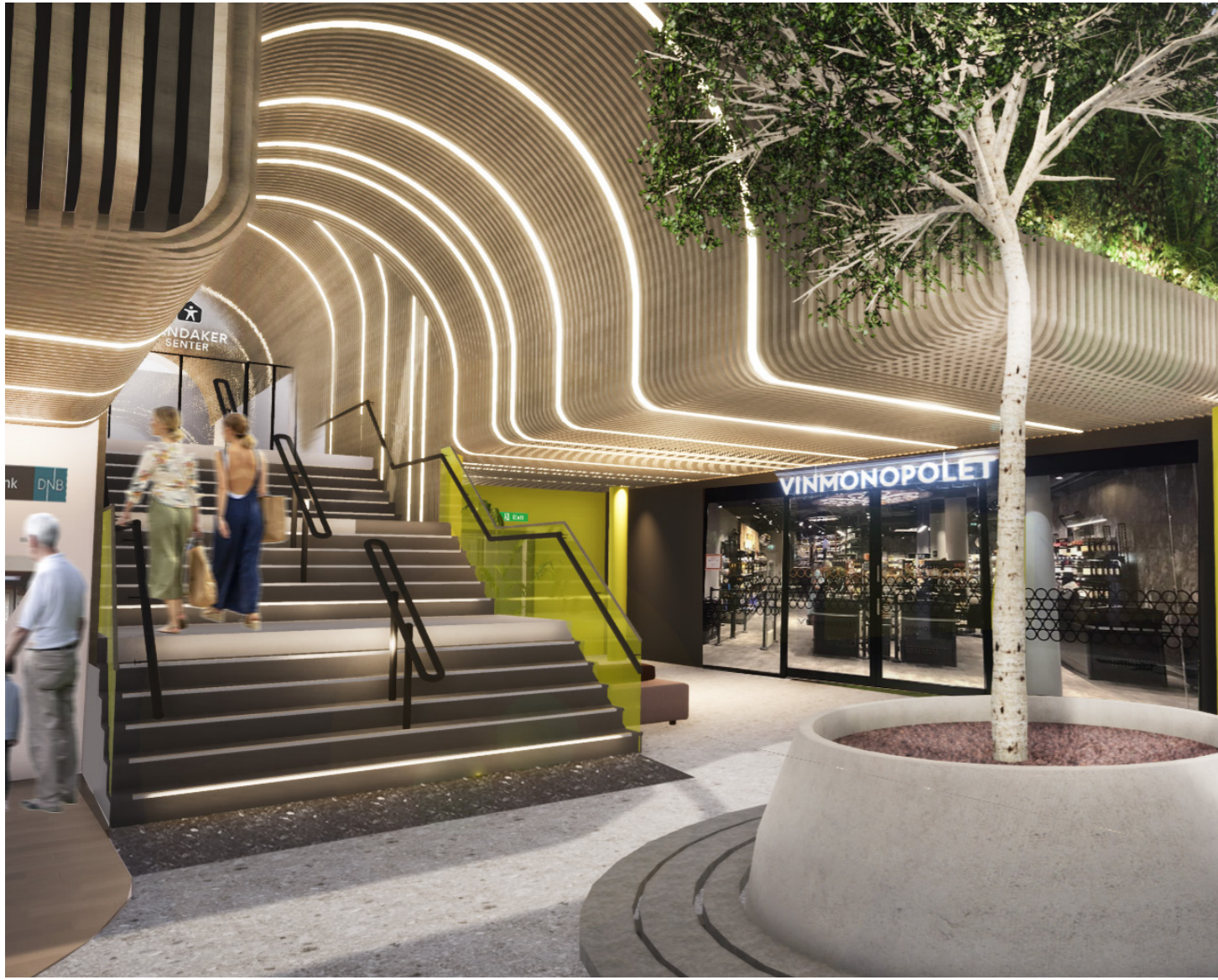
ILLUSTRASJON - TORGET MED TRAPP OPP TIL ÅSEGATA OG TAKHAGEN