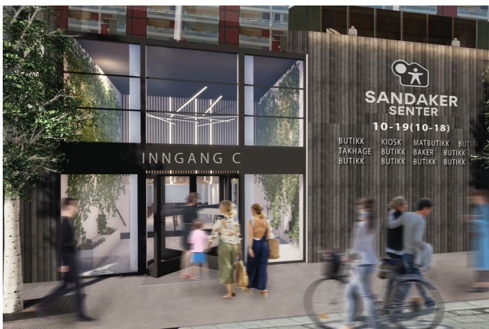
FASADE INNGANG C