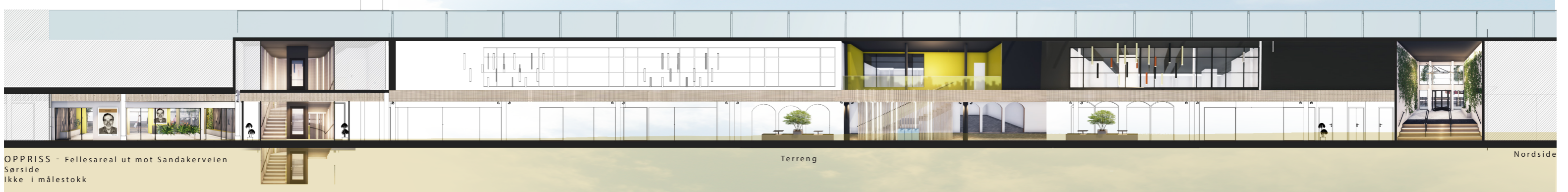
OPPRISS - Fellesareal ut mot Sandakerveien Sørside Ikke i målestokk