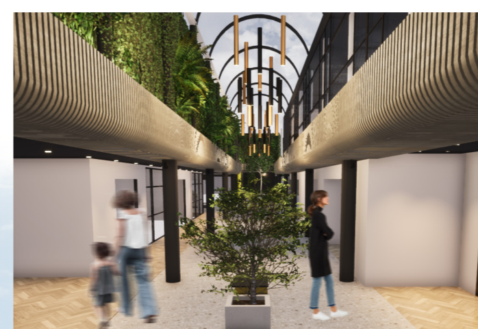
HANDLEGATE MED VERTIKAL HAGE OG OVERLYS