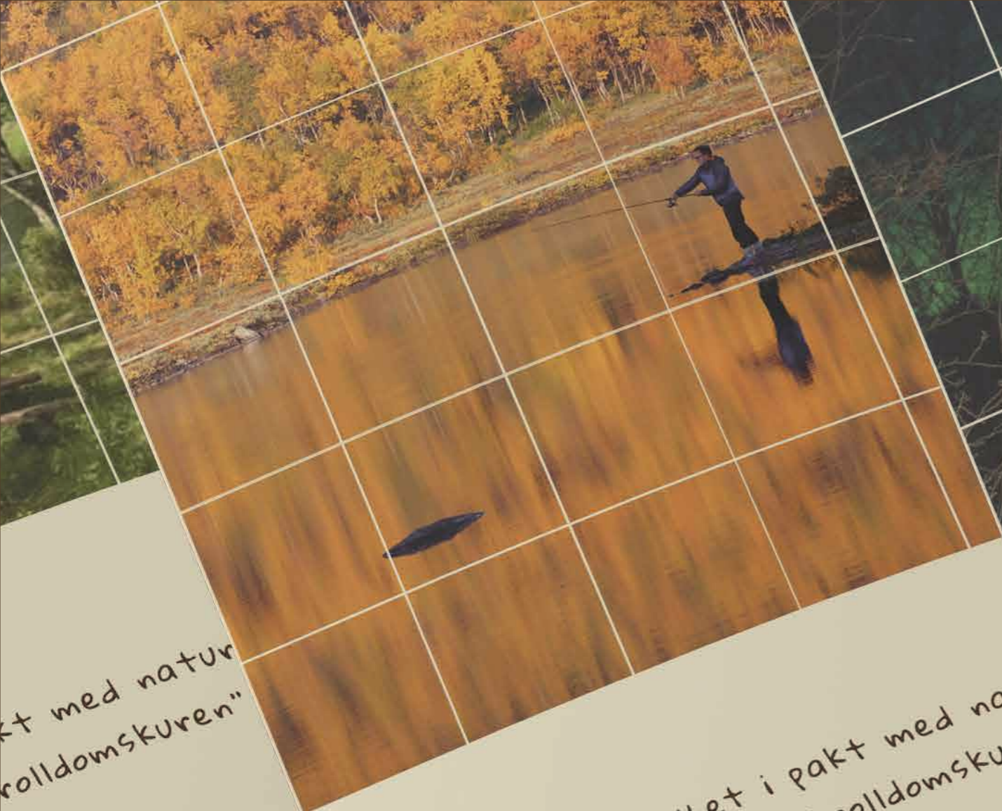
kt med natur trolldomskuren"

"Vi lever i stillhet i pakt med natur det er den rene trolldomskuren"