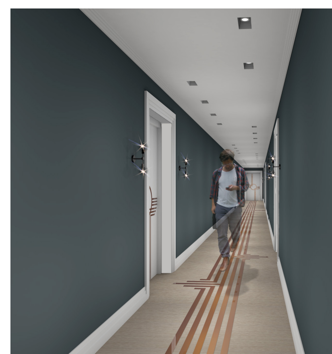
Førende korridor med spennende detaljer. Opplev å komme hjem.