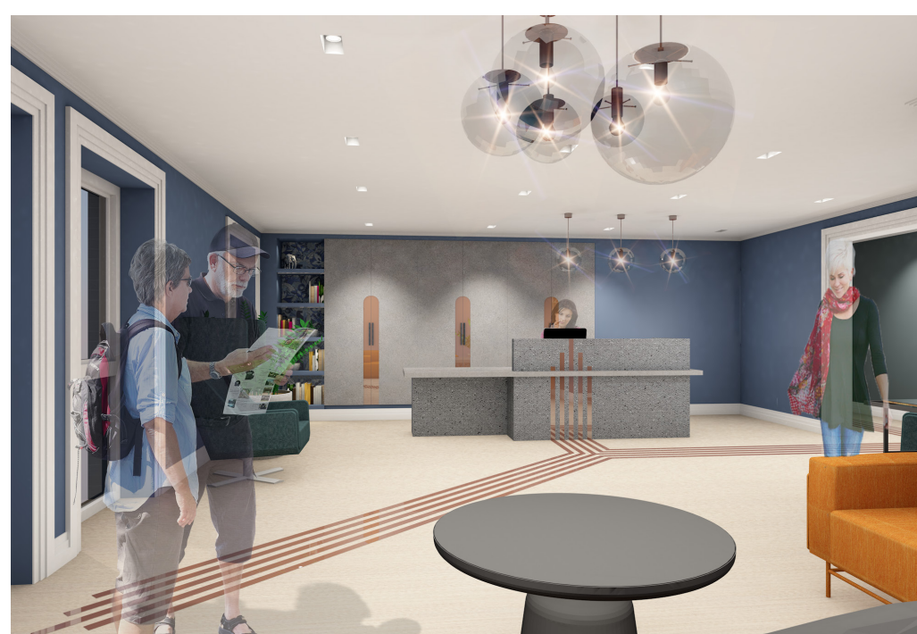
Tilhørende bygget er det blitt opprettet en resepsjon, som base for husverten. Spesielt hyggelig å komme hjem.