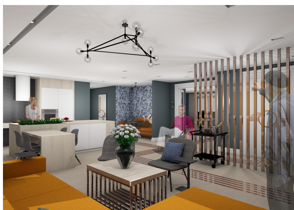
Ta en tur i fellesrommet i 7. etasje. Tilbring tid med andre, del et godt måltid, eller slapp av i folksomme omgivelser.