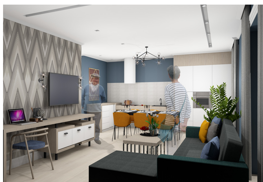
Innbydene og praktisk interiør i de private boenhetene. Nyt alenetiden i de friske omgivelsene. Inviter venner og familie.