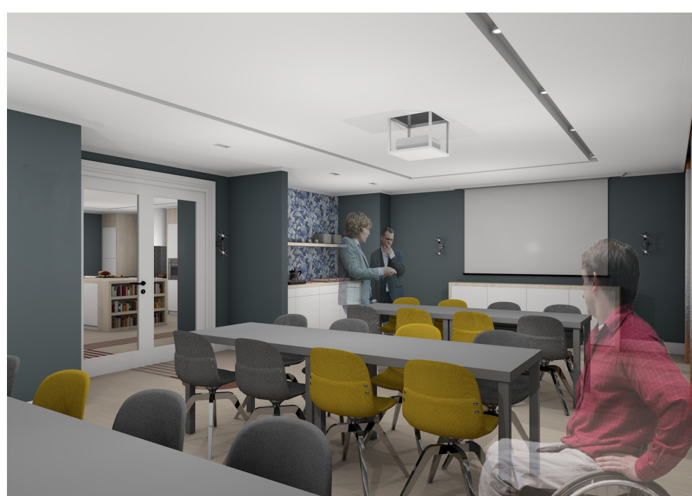
Benytt deg av fellesalen. Lei deg inn til et større privat arrangement, eller arranger noe felles for alle beboere.