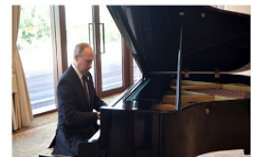
Vladimir Putin – «the piano man»

Every four years, we gather on these steps to carry out the orderly and peaceful transfer of power, and we are grateful to President Obama and First Lady Michelle Obama for their gracious aid throughout this transition. They have been magnificent.