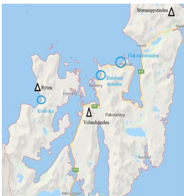
Figur 1.2 Steder nevnt i oppgaven

Øygruppen Lofoten er kjent for spesielt vakker natur med spisse fjell som stikker rett opp fra havet og hvite lange strender. Over kan du se figur 1.2 som viser stedene som blir snakket om av informantene. Under vil vi gi en liten presentasjon av de stedene som blir nevnt i oppgaven.