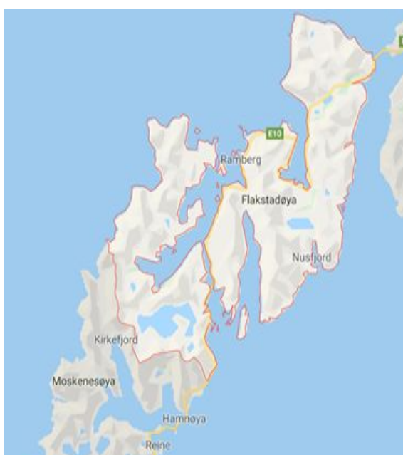
Figur 1.1 Flakstadøya og Moskenesøya

Kommunen vi har valgt i Lofoten er Flakstad kommune. Flakstad kommune er en av seks kommuner i Lofoten. Den strekker seg over hele Flakstadøya og litt av Moskenesøya slik vi kan se i Figur 1.1. Flakstadøya består av tettstedene: Sund, Mørkved, Skjelfjord, Ramberg, Flakstad, Nusfjord, Vareid, Vikten, Napp og Myrland. Området på Moskenesøya består av tettstedene: Mølnerodden, Andopen, Fredvang og Krystad. Kommunen har dermed et totalareal på 178,39 km 2 som inkluderer både sjø og land (Sandnes 2017). Til sammen i kommunen bor det 1293 innbyggere (SSB, per.1 kvartal 2019).