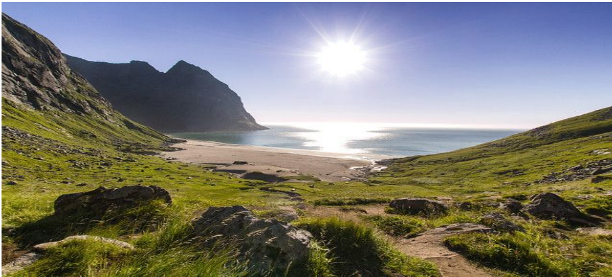
Figur 1.3 Kvalvika