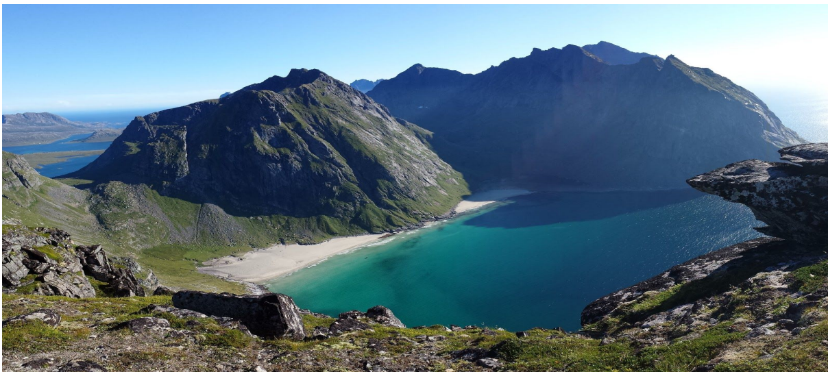
Figur 1.4 Ryten med utsikt ned til Kvalvika

Ryten er et fjell hvor du har utsikt ned mot Kvalvika og ut mot yttersiden. Det er dermed gode forhold for midnattsol her. Stien som går opp hit hadde i følge friluftsrådet 14 659 passeringer i perioden 28.05.2018 - 01.08.2018 (Rothli 2018). Fjelltoppen har 8491 innlegg på instagram under emneknaggen “Ryten”. Det er vanlig å kombinere turen til Ryten og Kvalvika da det er sti fra fjelltoppen og ned til stranden «Kvalvika».