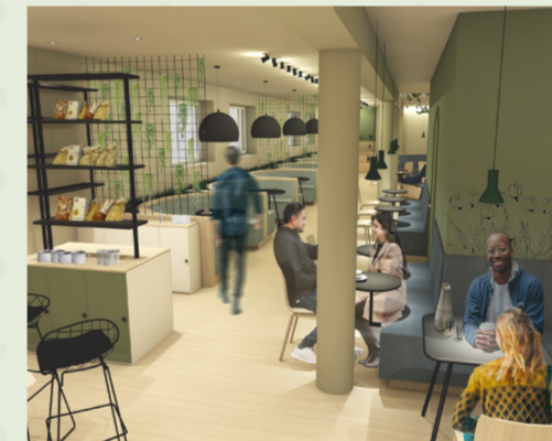
Oversikt fra disk, kafé