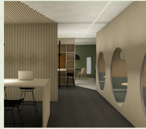
Sosial areidssone, co-working