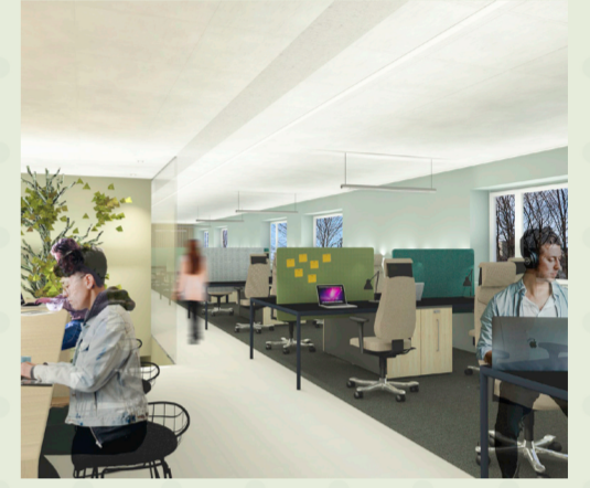
Åpent landskap, co-working